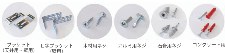
ブラケット (天井用・壁用)